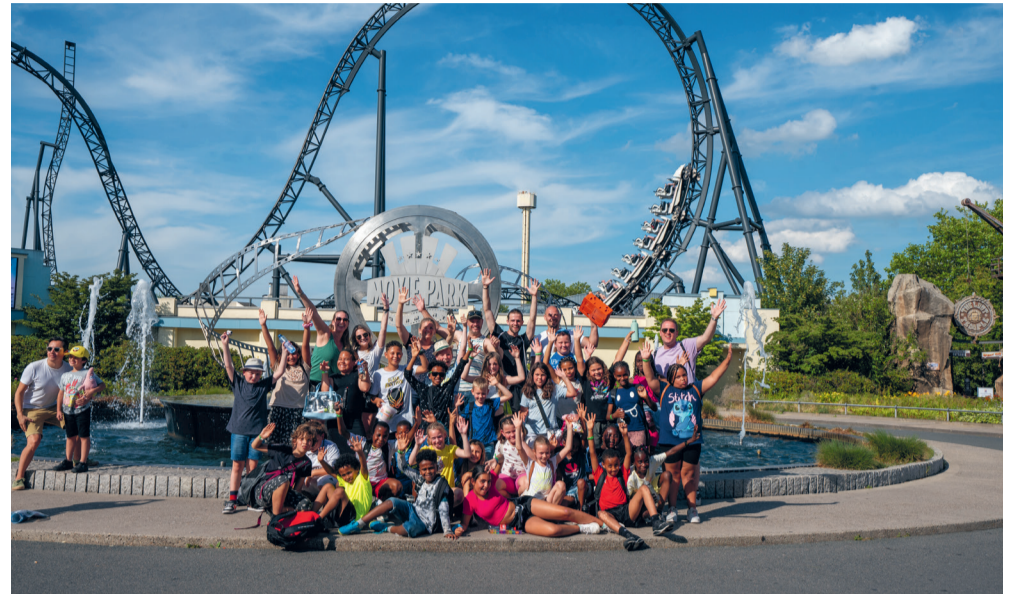
► Dit uitje was mogelijk door sponsors: Annemersbedrijf Peter van Bakel Zuilichem, Stipt advocaten, Mabelisa Fashion & 1 anonieme sponsor

Na het avondeten is er de avondspeurtocht en een dropping voor de oudere kinderen. Tijdens de lange wandelingen van plek naar plek op de heide ontstaan de mooiste gesprekken,